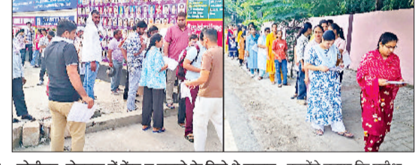
केंद्र के बाहर अभ्यर्थियों के कागजात की जांच करते पुलिस कर्मी व लगी लाइन।

सोनीपत, रोहतक में केंद्र न बनाने के मिले थे सुझाव : उन्होंने बताया कि परीक्षा से पूर्व अधिकारियों के साथ केंद्र बनाने पर चर्चा की गई थी। कुछ लोगों ने कहा कि सोनीपत, रोहतक, झज्जर में परीक्षा केंद्र नहीं होना चाहिए, पिछली बार भी यहां केंद्र नहीं बनाए गए थे। इन जिलों में पेपर में गड़बड़ी होने की उपायदा संभावना रहती है। इस बात पर उन्होंने कहा कि पूरे प्रदेश ही नहीं, बल्कि चंडीगढ़ में भी सीईटी लिया जा रहा है। प्रदेश में कोई भी जिला संवेदनशील नहीं है।