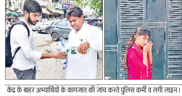
परीक्षार्थी को पानी पिलाने हुए समाजसेवी। आभूषण निकालती एक अभ्यर्थी।