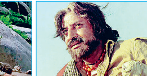
'उपकार' में मलंग के किरदार में प्राण

अंतर होता है। वह एक पैर में 9 नंबर और दूसरे पैर में 10 नंबर का जूता पहनता है। फिल्म 'शोले' में क्लाइमेक्स में जब टैबल पर अजीत के दोनों जूते दिखाए जाते हैं, तो फिल्म के नायक धर्मेन्द्र उसे चलेगा। फिल्म 'पैरों का करिश्मा' में मलंग के किरदार में प्राण 'शोले' का वो डायलॉग जिसमें गम्बर सिंह बसंतों से कहता है 'जब तक तेरे पैर चलेंगे, उसकी सांस चलेगी। जब तेरे पैर रुके, तो ये बंदूक चलेगी।' फिल्म 'मिस मेरी' में बचपन में बिछड़ी नायिका के पैरों की छह अंगुलियां, उसे अपने परिवार से मिलती है तो 'नाचे मयूरी' में सुधा चंद्रन के नकली पैरों से नर्तकी