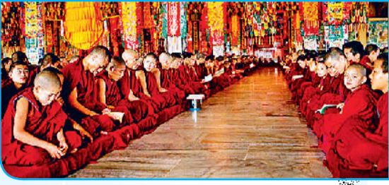
वर्षा के लिए प्रार्थना करते तिब्बती बौद्ध भिक्षु