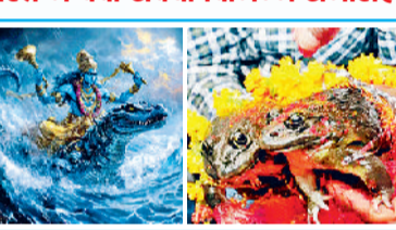
में मान्यता है कि बारिश न होने पर अजर सामूहिक तौर पर मंडक-मंडकी का विवाह करवा दिया जाए तो बारिश होती है।

हैं। यह अनुष्ठान हिंदू धर्म में वर्षा के देवता, भगवान इंद्र को समर्पित है। इसमें उनकी मूर्ति पर जल और दूध चढ़ाया जाता है। इसका उद्देश्य वर्षा के देवताओं को प्रसन्न करना और वर्षा लाना है। यह आमतौर पर गर्मी के महीनों में किया जाता है, जब वर्षा कम होती है। मंडकों का विवाह: देश के कई हिस्सों विशेष रूप से उत्तर, मध्य-पश्चिमी राज्यों राजस्थान, मध्य प्रदेश, उत्तर प्रदेश, गुजरात, छत्तीसगढ़ आदि के ग्रामीण और कई आदिवासी इलाकों में मंडक नृत्य करते हैं।