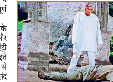
'शोले' में अमजद खान के साथ संजीव कुमार