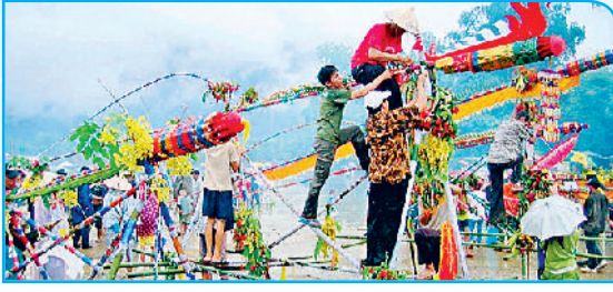
बन बंग फाई, थाईलैंड