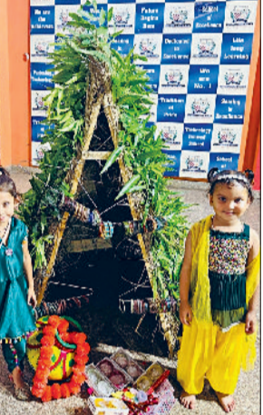
गन्नौर। हरियाली तीज रंग-बिरंगे परिधानों में सजे स्कूल के छात्र।