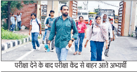
परीक्षा देने के बाद परीक्षा केंद्र से बाहर आते अभ्यर्थी

2537 रहे अनुपस्थित जिले में सीईटी के लिए 58 केंद्र बनाए गए हैं। शनिवार को पहले सत्र में 13321 तथा दूसरे सत्र में 13314 परीक्षार्थियों ने परीक्षा दी। सीईटी के लिए पहले सत्र में 14586 अभ्यर्थियों में से 13321 अभ्यर्थियों ने परीक्षा दी और 1265 अनुपस्थित रहे। पहले सत्र में 91.33 फीसदी अभ्यर्थियों ने परीक्षा दी। वहीं दूसरे सत्र में 14586 अभ्यर्थियों में से 13314 ने परीक्षा दी और 1272 अभ्यर्थी अनुपस्थित रहे। दूसरे सत्र में 91.28 फीसदी अभ्यर्थियों ने परीक्षा दी। सड़कों पर जाम के हालात दोनों सत्रों में परीक्षा शुरू होने से पहले और छूटने के बाद अभ्यर्थियों का रेला सड़कों पर देखने को मिला, जिसकी वजह से मुख्य रोड, ए बहालगढ़ रोड, गोहाना रोड, ककरोई चौक के पास, काठ मंडी के पास भीषण जाम की स्थिति बन गई। पुलिस एवं ट्रैफिक कर्मियों को जाम खुलवाने के लिए काफी परिश्रम होना पड़ा। आयी। कहीं कोई अराजकता न हो इसके लिए पुलिस आयुक्त ममता सिंह व डीसी सुशील सारवान भ्रमणशील रहे। प्रमुख अधिकारियों ने विभिन्न परीक्षा केंद्रों का औचक निरीक्षण किया।