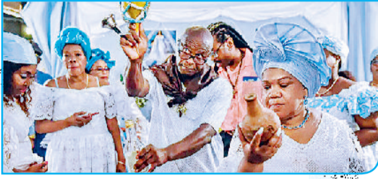
वोडू वर्षा नृत्य, हैती