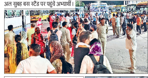
अल सुबह बस स्टैंड पर पहुंचते अभ्यर्थी।