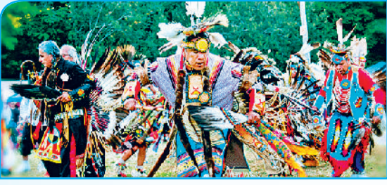
अमेरिकन रेन डास