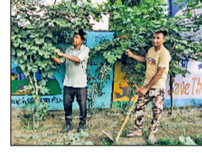
गोहाना। पौधों की बढ़ी हुई टहनियों की कटाई करते हुए समिति के

सोनीपत। उपायुक्त सुशील सारवान ने बताया कि 28 जुलाई को जिला परिषद हॉल में जिला स्तरीय तीज महोत्सव का आयोजन किया जा रहा है। इस महोत्सव में हरियाणा के सहकारिता मंत्री डॉ. अरविंद शर्मा बतौर मुख्यातिथि शिरकात करेंगे। उन्होंने बताया कि अंबाला में राज्य स्तरीय महोत्सव का आयोजन किया जाएगा, जिसमें मुख्यमंत्री श्री नयब सैनी विडियों कॉन्फ्रेंस के माध्यम से प्रदेश में आयोजित जिला स्तरीय महोत्सव में भाग ले रही महिलाओं को संबोधित करेंगे। उपायुक्त ने बताया कि जिला स्तरीय तीज महोत्सव में स्वयं सहायता समूह से जिला की एक हजार महिलाएं भाग लेंगी।