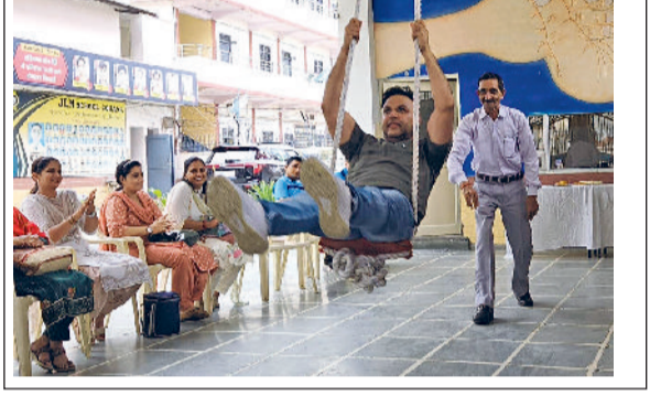
गोहाना। समारोह में झूला झूलते हुए गुरुजी।