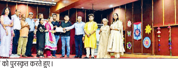
सोनीपत। कार्यक्रमें के दौरान विजेताओं को पुरस्कृत करते हुए।