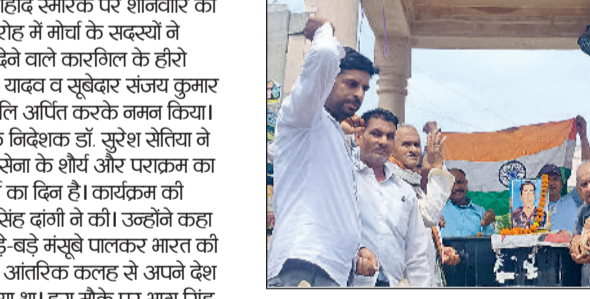
सोनीपत। करगिल युद्ध के शहीदों को श्रद्धांजलि देते हुए मोर्चा के सदस्य।