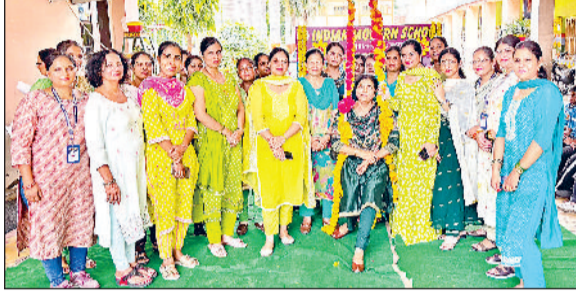
सोनीपत इंडियन मॉडर्न स्कूल में आयोजित कार्यक्रम के दौरान झूला झूलती प्रबंधक साथ में विद्यालय स्टाफ।