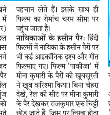
पहचान लेते हैं। इसके साथ ही फिल्म का रोमांच चरम सीमा पर पहुंच जाता है। नायिकाओं के हसीन पैर: हिंदी फिल्मों में नायिका के हसीन पैरों पर भी कई आइकॉनिक दृश्य और गीत फिल्माए गए। फिल्म 'पाकीजा' में मीना कुमारी के पैरों की खूबसूरती ने खूब करिश्मा किया। बिना चेहरा देखे, रेल की सीट पर मीना कुमारी के पैर देखकर राजकुमार एक चिट्ठी छोड़ जाते हैं, जिस पर लिखा होता

अंतर होता है। वह एक पैर में 9 नंबर और दूसरे पैर में 10 नंबर का जूता पहनता है। फिल्म 'शोले' में क्लाइमेक्स में जब टैबल पर अजीत के दोनों जूते दिखाए जाते हैं, तो फिल्म के नायक धर्मेन्द्र उसे चलेगा। फिल्म 'पैरों का करिश्मा' में मलंग के किरदार में प्राण 'शोले' का वो डायलॉग जिसमें गम्बर सिंह बसंतों से कहता है 'जब तक तेरे पैर चलेंगे, उसकी सांस चलेगी। जब तेरे पैर रुके, तो ये बंदूक चलेगी।' फिल्म 'मिस मेरी' में बचपन में बिछड़ी नायिका के पैरों की छह अंगुलियां, उसे अपने परिवार से मिलती है तो 'नाचे मयूरी' में सुधा चंद्रन के नकली पैरों से नर्तकी