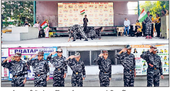
खरखौदा। शहीदों को समर्पित कार्यक्रम प्रस्तुत करते विद्यार्थी।