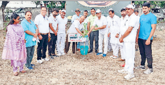
सोनीपत। पौधारोपण करते हुए मुख्यातिथि साथ में अन्य।